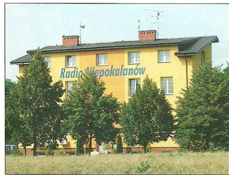
Tak wyglądał pod koniec 2009 r.