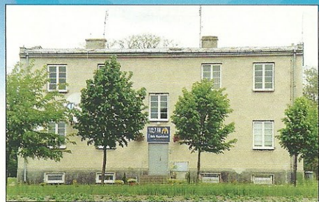
Wygląd budynku radiowego na początku wznowionej działalności w 1995 r.

Kiedy patrzę wstecz, na moją 7-letnią obecność w tym miejscu, zastanawiam się, dlaczego jeszcze jesteśmy? Tyle razy